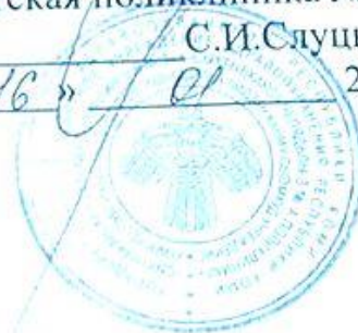
ГРАФИК РАБОТЫ медицинской сестры ООМПДОУ ДПО-3 ГБУЗ РК «Сыктывкарская детская поликлиника №3» Фирсовой Елены Львовны в медицинском кабинете МАДОУ «Детский сад №104/3»

понедельник 14.00 – 17.00 вторник 07.30 – 10.30 среда 14.00 – 17.00 четверг 07.30 – 10.30 пятница 14.00 – 17.00