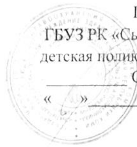
ГРАФИК РАБОТЫ МЕДИЦИНСКОЙ СЕСТРЫ

ООМПДОУ ГБУЗ «Сыктывкарская детская поликлиника № 3»